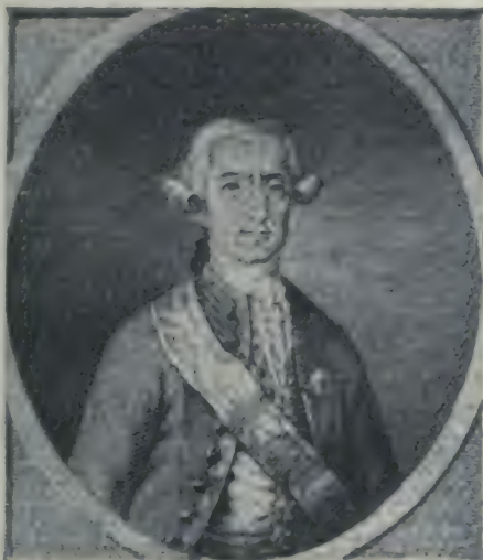
Le Comte de Florida Blanca.

L'ambassadeur de Louis XVI à Madrid, le duc de La Vau-